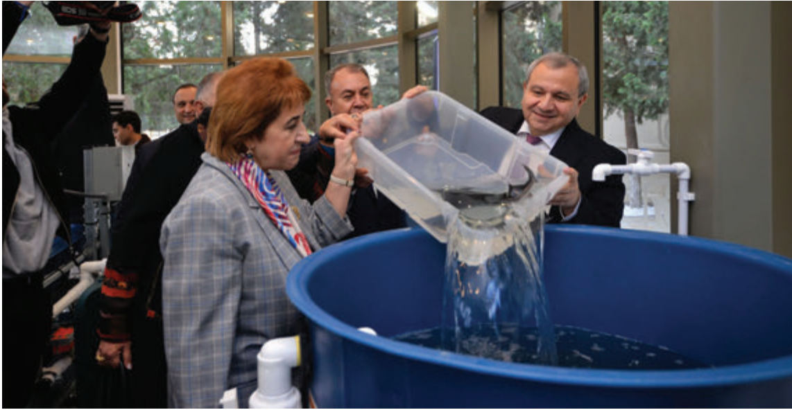
(əvvəli 8-ci səhifədə)

Layihə çərçivəsində BDU yalnız yerli ekoloji təşkilatlarla deyil, beynəlxalq təşkilatlarla da sıx əməkdaşlıq etmək niyyətindədir. Bu əməkdaşlıq sayəsində ətraf mühitin qorunması mövzusunda qabaqcıl təcrübələrin Azərbaycana gətirilməsi və yerli ekoloji təşkilatların fəaliyyətlərinin beynəlxalq səviyyədə tanınması üçün zəmin yaradılacaq. Təşkil olunacaq könüllülük proqramları əsasında tələbələrin yerli və beynəlxalq ekoloji fəaliyyətlərə cəlb olunması planlaşdırılır.